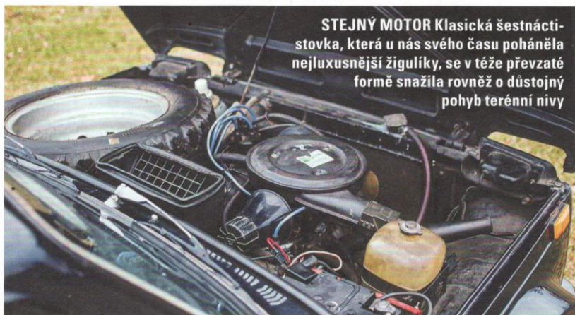
STEJNÝ MOTOR Klasická šestnáctistovka, která u nás svého času poháněla nejluxusnější žigulíky, se v téže převzaté formě snažila rovněž o důstojný pohyb terénní nivy

Stále ještě uzavřená niva před námi nyní nesměle odkládá střechu. Tuhle složitou práci si zjednodušujeme zapojením dvou lidí. Principiálně se plátno shrnuje jednoduše pomocí zipů, jenže trefit se do nich přesně jezdcem vyžaduje trpělivost. Pod rozměrným a patřičně vyztuženým plátnem se totiž rozprostírá pevný ochranný rám,